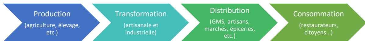
Figure 2 : approche chaîne de valeur de l'alimentation

Pour faciliter l'appropriation, il est important de garder en tête la chaîne de valeur d'un produit alimentaire ainsi que les différents acteurs qui la compose (figure 2).