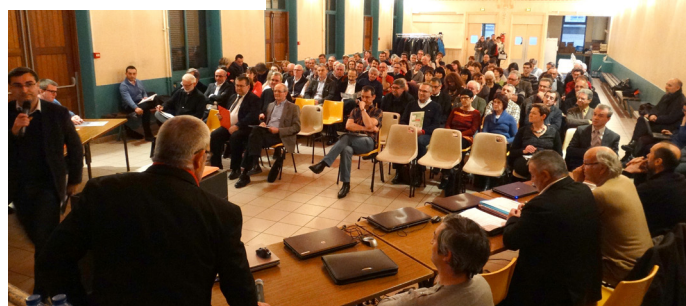
« Rives du Rhône 2040 » mardi 17 février à Ampuis 120 élus locaux se sont exprimés sur leur perception et leur vision d'avenir du territoire.